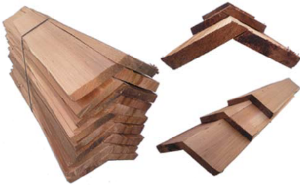
設計価格 13,000円/束 (3,421円/m 葺足190mm)

シダーシェイク・シングル用リッジキャップ(棟用の役物)です。シェイク・シングル同様、レッドシダーのクリア材から加工したプレミアムグレード、NO.1グレードと最高級のグレードです。