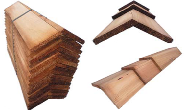
設計価格 20,000円/束 (4,000円/m 葺足140mm)